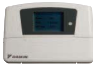
Пульт дистанционного управления