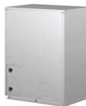
PQHY-P200YHM-A PQHY-P250YHM-A PQHY-P300YHM-A