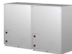
PQHY-P400YSHM-A PQHY-P450YSHM-A PQHY-P500YSHM-A PQHY-P550YSHM-A PQHY-P600YSHM-A