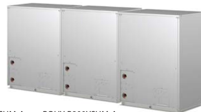
PQHY-P650YSHM-A PQHY-P800YSHM-A PQHY-P700YSHM-A PQHY-P850YSHM-A PQHY-P750YSHM-A PQHY-P900YSHM-A